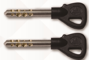
【非常用メカニカルキー】